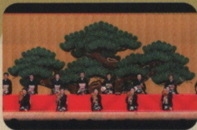
オープニングパフォーマンス 金沢素囃子